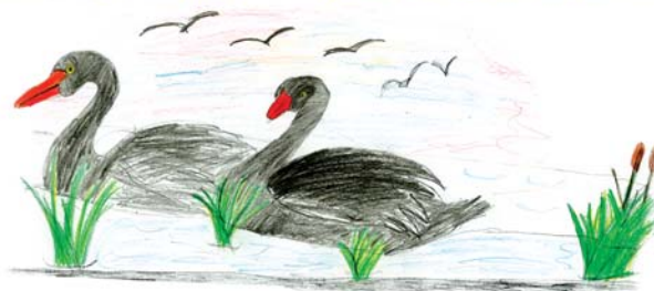
Рисунок: Миша Майзель